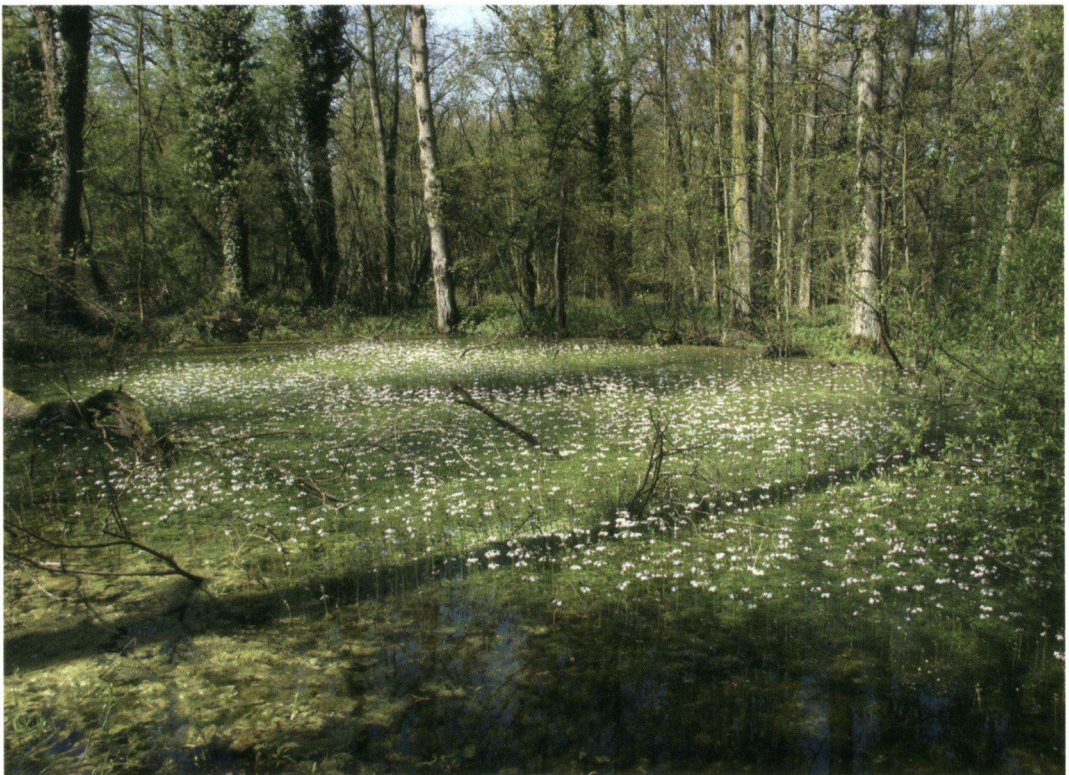
Figuur 2. Verlande Bomput met bloeiende Watervioolier ( Hottonia palustris ) in de Wellemeersen, zomer 2007 (Welle - Denderleeuw).

In een meer centraler gelegen ooit vrij voedselrijke, te intensief begraasde weide werd het biotoop door het uitdiepen van sterk verlande poelen en slenken in combinatie met een extensieve begrazing omgevormd tot een structuurrijke moerasvegetatie. De weide is ten noorden begrensd door een vochtig elzenbosje. In het zuiden en gedeeltelijk ook in het westen door een permanent onder water staand broekbos. Ten oosten is de vloeiveide begrensd door een bosvegetatie op de drogere oeverwal. Door deze beschermde ligging ontstaat een eigen microklimaat waardoor de weide bijzonder attractief is voor libellen en dan vooral voor heidelibellen. Er werden in de periode 1996-2007 maar liefst zeven Sympetrum -soorten waargenomen waaronder Bandheidelibel ( Sympetrum pedemontanum ) (SOORS, 2000) en Zwervende heidelibel.