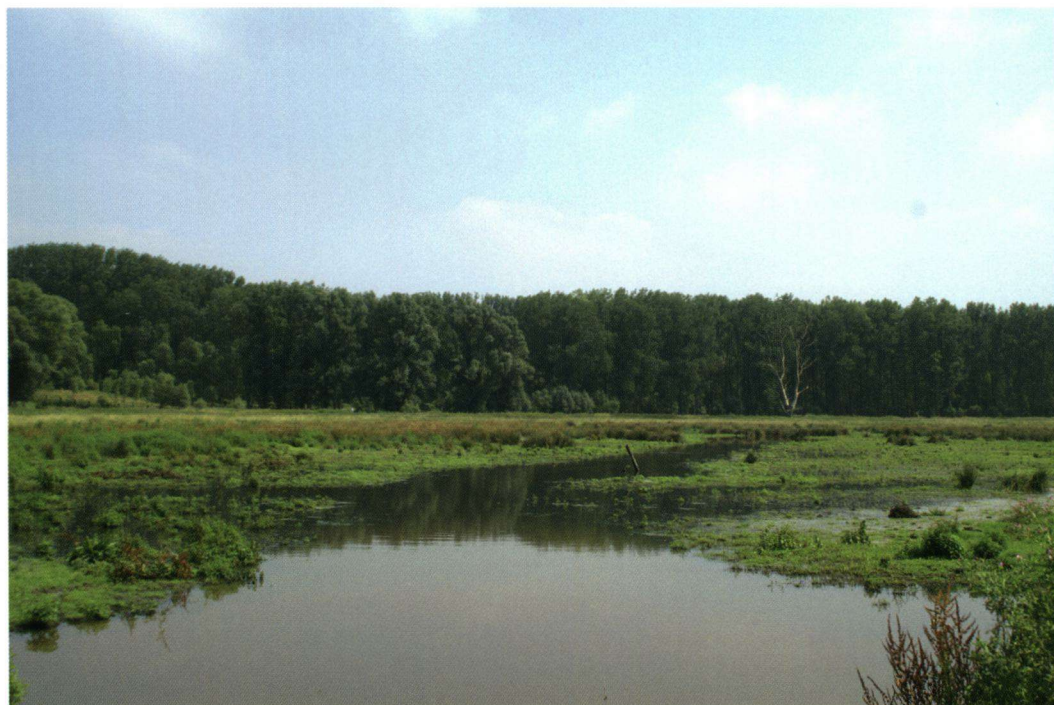
Figuur 3. Vloeiweide in het noordelijk deel van de Wellemeersen (Erembodegem - Aalst). Hier werden tussen 10 en 14 juli 2005 twee mannetjes Zuidelijke glazenmaker ( Aeshna affinis ) waargenomen.

Flooding meadow in the northern part of the Wellemeersen (Erembodegem - Aalst). At this site two males of Anax parthenope were observed between the 10th and the 14th of July 2005 (zomer 2007. Foto: Bruno De Bruyn).