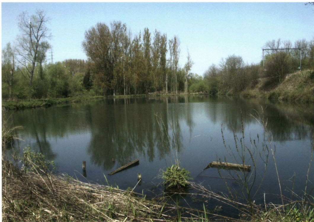
Figuur 1. De Grote Zavelput in de Wellemereen (Welle - Denderleeuw), één van de libellenrijke biotopen van het gebied, zomer 2007.

The Grote Zavelput in the Wellemereen (Welle-Denderleeuw), one of the species-rich dragonfly biotopes in the area, summer 2007 (Foto: B. De Bruyn).