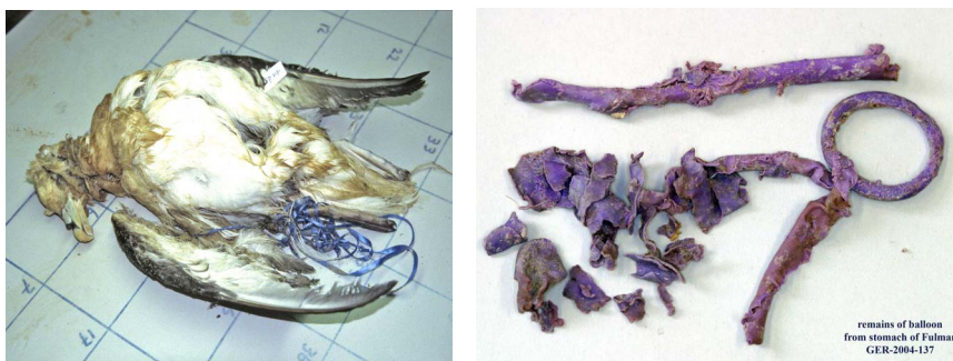
Links: een ballonlint aan de poot van een aangespoelde Noordse Stormvogel, rechts: de schamele resten van een (parse) ballon uit de maag van een Noordse Stormvogel. - Left: a ribbon of a balloon attached to the leg of a beached Northern Fulmar, right: the stomach contents of another fulmar, the remains of a (purple) balloon

Noordse Stormvogels Fulmarus glacialis worden gebruikt in het onderzoek naar hoeveelheden zwerfvuil in de Noordzee ( Marine Litter EcoQO ). Ballonresten in de vogelmagen vergaan snel en zij zullen vaak niet worden herkend. Nog wel herkenbare resten van ballonnen werden in 1- 2% van de onderzochte stormvogelmagen aangetroffen. Slechts één keer is ook een ventiel in de maag aangetroffen. Wanneer een groot stuk ballonrubber is ingeslikt, dan kan dat de doorgang van maag naar darm blokkeren en komt de vogel om door verhongering. Wat de effecten van kleinere stukken opgegeten ballonrubber zijn, is onduidelijk, maar gezond is het uiteraard niet.