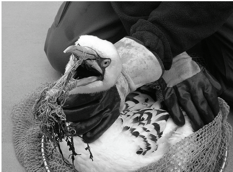
Verstrikte Jan van Gent- Entangled Northern Gannet.

Camphuysen C.J. 1990. Verstrikking van zeevogels in plastics: een probleem van toenemende omvang? Sula 4(1): 12-18.