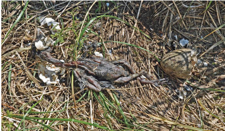
Figuur 1. Naakt donsjong van Kauwtje als kuikenvoedsel op de nestrand van Zilvermeeuw ZM308, Kelderhuispolder 30 mei 2009; de drie kleine jongen (1-3 dagen oud) zijn voor metingen uit het nest genomen, maar een eierdop resteert nog van het die dag uitgekomen jong. Jackdaw pullus as chickfeed at the nest of Herring Gull ZM308, Kelderhuispolder 30 May 2009; the three small chicks were taken for measurements, but the eggshell of the smallest chick (hatchling of the day) is still present