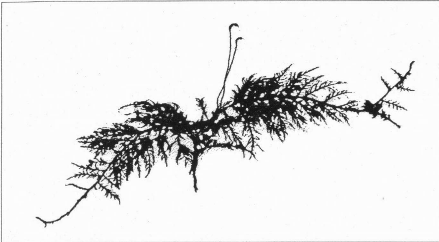
Kopie sporenkapsels Thujamos Bakkeveen in 1994

Het FFF-Mossenproject Fryslân startte op 14 november 1987. Sindsdien zijn er talrijke rapporten verschenen over de verspreiding van mossen in Fryslân. Het uiteindelijke doel is heel Fryslân te inventariseren op blad- en levermossen. Een flinke klus, die naar verwachting pas omstreeks het jaar 2015 geklaard zal zijn. Daarom hieronder even een adempauze met het Thujamos.