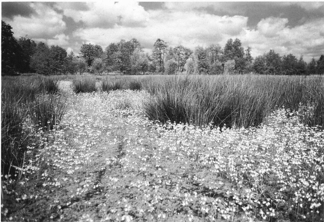
Bloeiende Watervolieren in de Wolwarren, Alde Feanen

Bij onderzoek naar de flora van het beekdal van de Boorne (regionaal ook wel 'Ald djip' of 'Koningsdiep' genoemd) kwam de FFF-Plantenwerkgroep Drachten e.o. de fraaie Watervolier verschillende keren tegen in kwelslootjes, reden waarom deze werkgroep haar als jubileumsoort heeft uitgekozen in het kader van 25 jaar FFF.