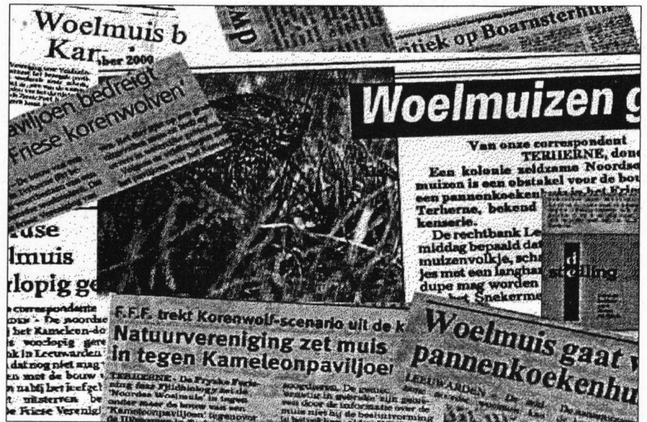
Collage van krantenkoppen