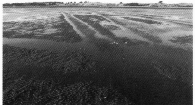
Sporen van kokkelvisserij op het Posthuiswad bij Vlieland