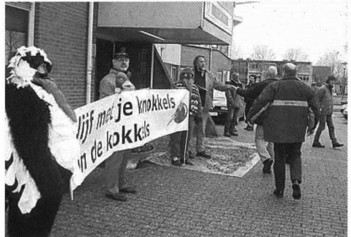
De SP in actie in Franeker

In de presentatie kwam tevens naar voren dat er in de Waddenzee in vergelijking met de jaren '80 zo'n 100.000 Scholeksters minder zijn. Toen werden tijdens tellingen aantallen vastgesteld in de orde van grootte van 260.000 exemplaren, terwijl dit nu al jaren rond de 160.000 zit. Naar aanleiding daarvan vroeg Kleefstra hoeveel Scholeksters de Waddenzee nu zou herbergen wanneer rond 1990 niet alle mosselbanken waren weggevisst en er geen mechanische kokkelvisserij had plaatsgevonden. Volgens onderzoeker Jaap de Vlas zouden er dan waarschijnlijk zo'n 100.000 exemplaren meer zijn dan er nu geteld worden, ofwel: de sterke