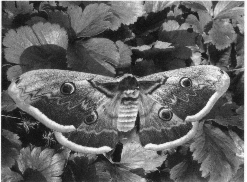
De nieuwe adventief voor Fryslân: de Grote nachtpauwoog.