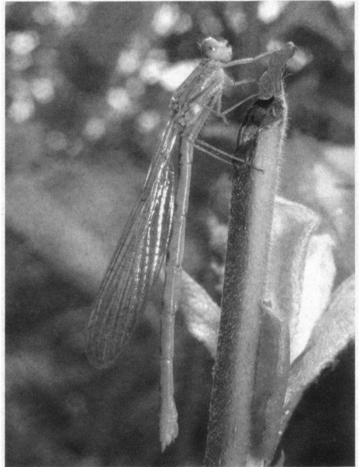
Vers vrouwtje van de Noordse winterjuffer

Over het, ecologisch zeer interessante, geslacht Leucorrhinia is dit jaar opnieuw spectaculair nieuws te melden. Na het opduiken van de Oostelijke witsnuitlibel L. albifrons in 2005 op de Delleboersterheide, werd heel libellenminnend Nederland nogmaals met stomheid geslagen toen begin juni 2006 in Zuid-Limburg (ENCI-groeve) opeens een Sierlijke witsnuitlibel L. caudalis werd gezien. Een mannetje kon daar enkele dagen achtereen bewonderd worden op zijn vaste lelieblad. Nog ver