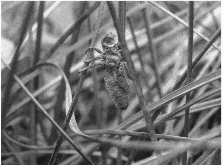
Larvenhuidje van de Hoogveenglanslibel

Deze fascinerende soort is tegenwoordig plaatselijk geen zeldzame verschijning meer in Fryslân. We verwachten dat de glanslibel zich, vanwege een 'overloopeffect', in de nabije toekomst op meer plekken in Fryslân zal kunnen opduiken. Ook moerassige plaatsen met een afwisselende en bosrijke vegetatiestructuur op de hogere zandgronden (vennencomplexen en matig voedselrijke overgangen rond hoogvenen) behoren tot de mogelijke voortplantingslocaties.