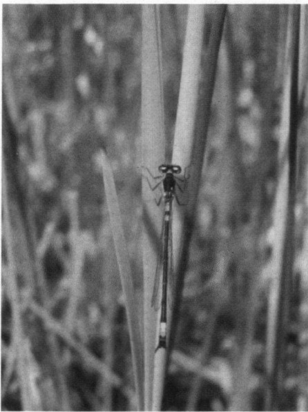
Donkere waterjuffer

jaar (na de overwintering) voldoende dieren op geschikte plekken terecht komen, dan bestaat de kans dat zij ook het midden van Fryslân kunnen koloniseren. Hier liggen tegenwoordig weer voldoende kwalitatief geschikte voortplantingslocaties (Tjongerdellen, omgeving Heerenveen, De Deelen en Alde Feanen). Wij denken dat de Noordse winterjuffer in vroeger tijden op vele plekken in Fryslân voortplantend aanwezig is geweest. Dat zij hier door biotoopvernietiging is verdwenen en dat we nu getuige zijn van een spectaculaire comeback van deze West-Europese zeldzaamheid.