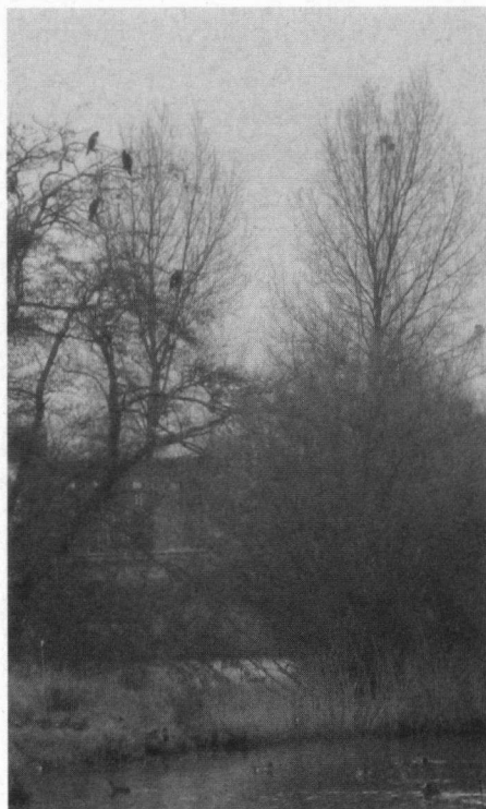
Enkele Aalscholvers op de slaappleats in het Rasterhofpark in Sneek.

toen met name op de Steile Bank grote aantallen werden vastgesteld. Hier werden nu minder Aalscholvers geteld, maar daar staat tegenover dat bij Cornwerderzand, op de Warkumerbûtenwaard, op de Bocht fan Molkwar en bij het Woudagemaal juist meer individuen zijn geteld (tabel 1, figuur 1). De Mokkebank en Lemsterhoek bleven vrijwel onbezet, maar dienden als voorverzamelplaatsen vanwaar Aalscholvers onder meer richting de Steile Bank vlogen. De afname op de Steile Bank en de Warkumerbûten-