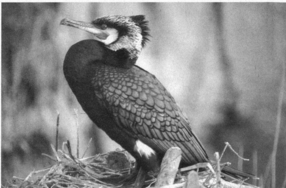
Aalscholver in broedkleed

Evenals in 2003/04 is het Waddengebied buiten beschouwing gelaten. Aalschol-