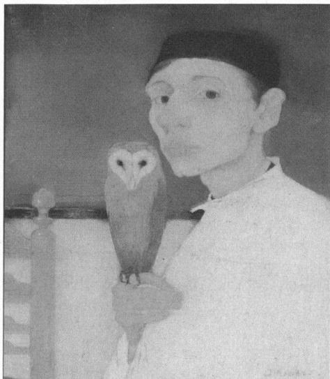
Zelfportret met uil (sch.42)