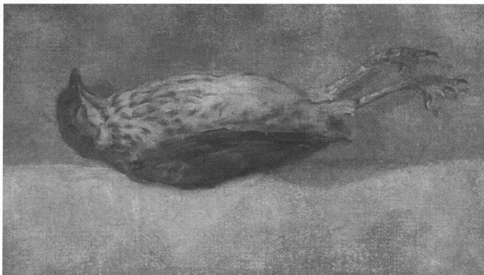
Dood vogeltje (sch.184)