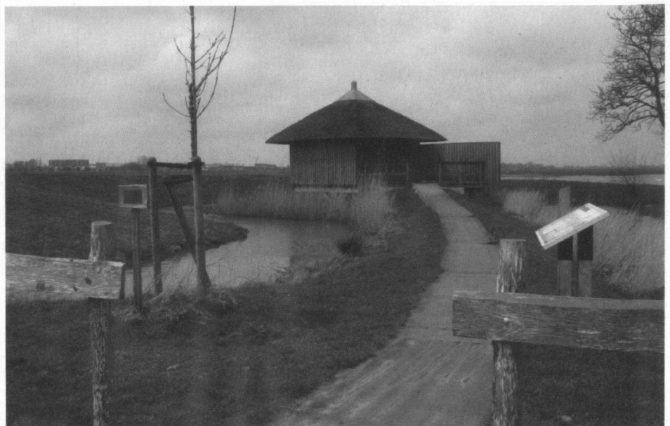
Vogelkijkhut op Skrok