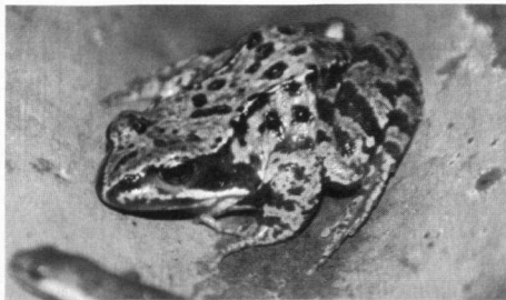
Bruine kikker, foto Teddy Dolstra