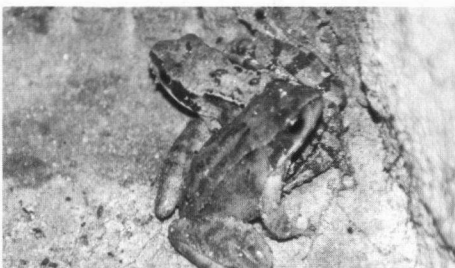
Jonge Bruine kikkers in ijskelder te Veenklooster