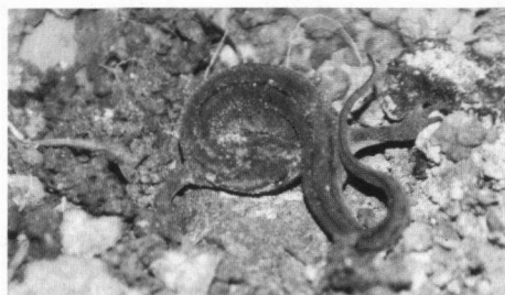
Kleine watersalamander in winterverblijf Steggerda