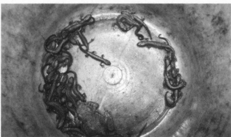
Totaal aan overwinterende amfibieën in kelder te Steggerda in de winter 2007/2008