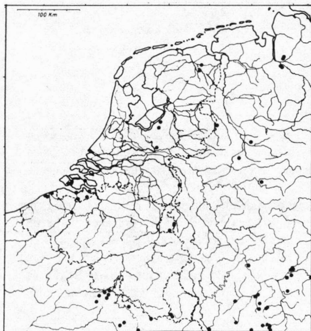
figuur 1: Verspreiding van M. roeselii van voor 1980, gebaseerd op museummateriaal (Duijm & Kruseman, 1983)

De verspreiding van M. roeselii van vóór 1980 wordt gegeven door Duijm & Kruseman (1983) (fig 1). De recente verspreiding, gebaseerd op waarnemingen uit de jaren 1985 - 1990, geef ik in figuur 2. Er zijn drie zaken die opvallen: Ten eerste is het aantal recente vindplaatsen groter dan het aantal oude. De stelling dat M. roeselii uit Nederland aan het verdwijnen zou zijn, is dus duidelijk niet houdbaar. Ten tweede is de soort op bijna alle oude