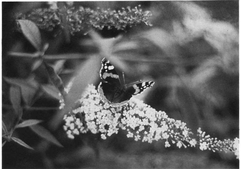
De Vlinderstruik, oftewel Buddleia trekt vele vlinders aan, zoals deze Atalanta.