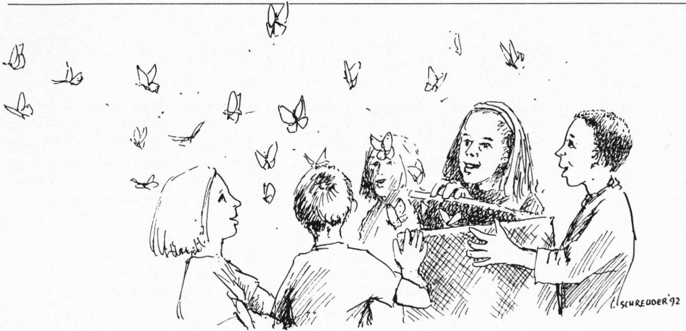
Het loslaten van de zelf gekweekte vlinders. Tekening: Geert Schreuder.

school in het teken van de vlinders. Drie weken lang hebben 350 kinderen zich met vlinders bezig gehouden. Kleuters timmerden houten vlinders en de hoogste groepen bestudeerden levende vlinders in de omgeving en in de klas. Onder grote belangstelling van ouders en pers werden zelf gekweekte vlinders, Grote koolwitjes, in de omgeving losgelaten. Dit evenement zal in de omgeving van Ter Aar zeker een sterke uitstraling hebben. In geuren en kleuren zullen de kinderen thuis vertellen over de prachtige vlinders die ze uit de pop zagen kruipen. Menig ouder zal gevraagd worden om zo snel mogelijk een Buddleia aan te planten.