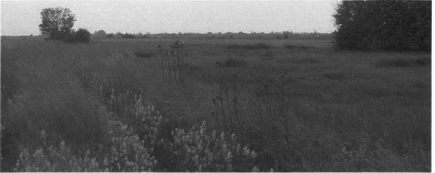
De schraallanden van de Meye, de laatste vliegplaats van de Aardbeivlinder in het projectgebied.

Er zijn tellers geweest die vele kilometers door het gebied fietsten en overal de waargenomen vlinders hebben genoteerd. Anderen hebben een bepaald gebied 'geadopteerd'. Zij bezochten dit een aantal malen per jaar en vaak werd ook de eigen tuin heel goed onderzocht. Vanuit De Vlinderstichting werden vlinderteldagen georganiseerd, waarbij alle natuurreservaten werden bekeken op het voorkomen van karakteristieke vlinders.