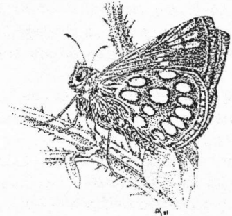
Spiegeldikkopje - Tekening: Adri Karman.

Ook heeft Natuurmonumenten aan De Vlinderstichting gevraagd in een aantal gebieden de vlinders te inventariseren. Bij het opstellen van een nieuw beheersplan voor deze gebieden kan dan met de eisen die vlinders stellen rekening worden gehouden. Hierdoor zal de vlinderstand zich in een groot aantal terreinen kunnen herstellen.