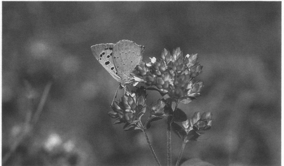
Kleine vuurvlinder op Marjolein

De Kleine vuurvlinder stelt ons echt voor vraagtekens. Op bepaalde plaat-