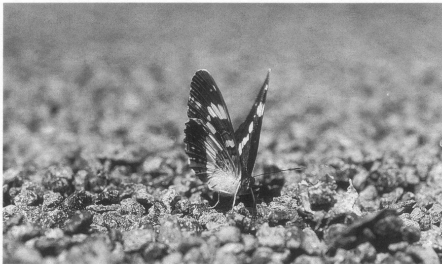
Kleine ijsvogelvlinder vocht drinkend op een asfaltweg

ment dat dit geschreven wordt (begin juli) vliegt de soort nog volop en aan het eind van het seizoen kan natuurlijk pas echt de balans worden opgemaakt. Vanuit de Westelijke Achterhoek zijn al diverse meldingen binnen-