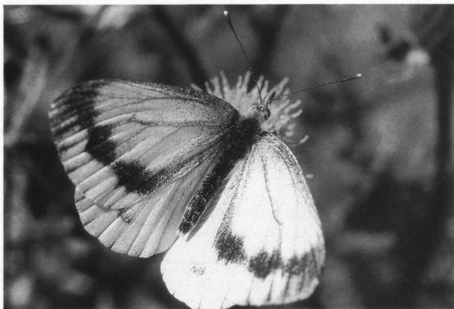
Een opvallende kleurvariatie van het Klein geaderd witje