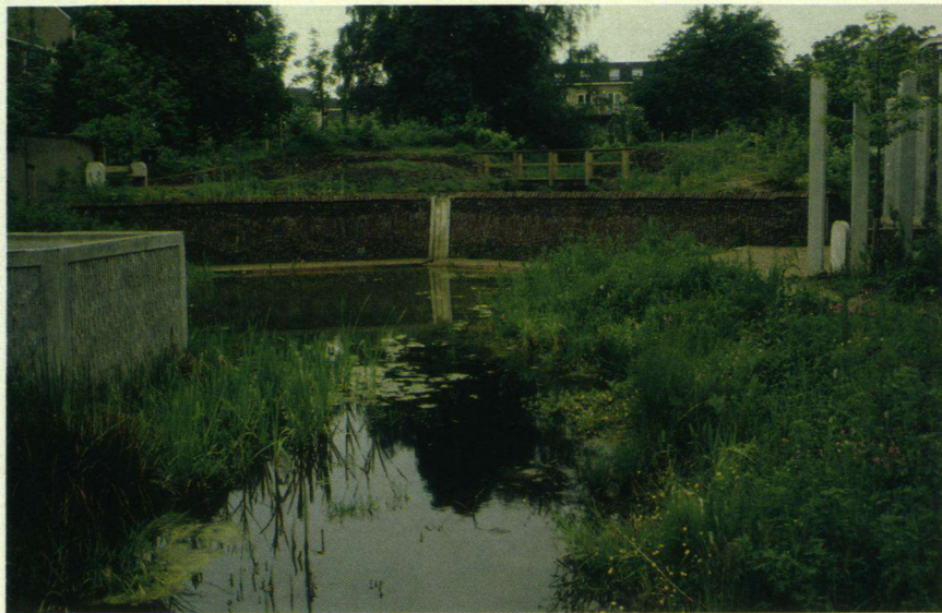
Een deel van de Ecologische tuin in het Spijkerkwartier.

ders, op zoek naar nectar, komen erheen. Vanwege de ligging wordt de tuin de 'Achtertuin' genoemd.