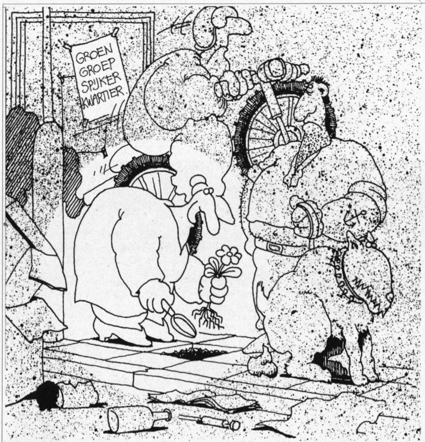
tekening: Loet van Moll

In 1985 werd op het lege binnenterrein door de gemeente een tuin aangelegd overeenkomstig een plan van de direct aanwonenden. Sindsdien wordt hij onderhouden door een echte tuinliefhebber. Zij verving eenvormige struikenpartijen door een gevarieerd geheel van decoratieve en rijkbloeiende planten. Nu is het een echte bordertuin. Talloze vlin-