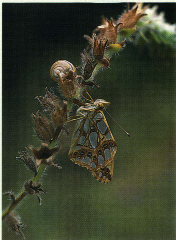
Van alle parelmoervlinders heeft de Kleine parelmoervlinder wel de fraaiste vlekken.