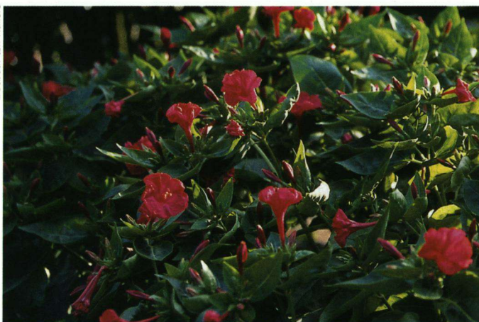
Nachtschone ( Mirabilis jalapa ).