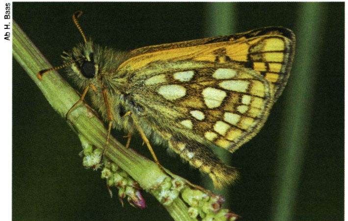
Op de route bij Reusel kun je wel 30 soorten waarnemen, waaronder het bont dikkopje.

de laatste jaren wel afgenomen). Groentje en heivlinder (waarvan er in 1990 nog 35 geteld werden) zijn nu al een aantal jaren niet meer waargenomen.