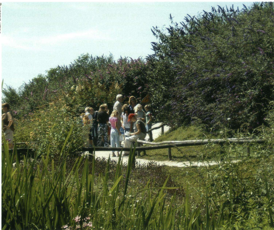
Met hulp van De Vlinderstichting is een vlindervallei gerealiseerd.

Het educatieve programma dat hiernaast beschreven wordt, is totstandgekomen met subsidie vanuit de regeling Leren voor een Duurzame Samenleving van de provincie Noord-Brabant. In de loop van 2004 zal ook een programma voor de bovenbouw van middelbare scholieren over vlinders en libellen beschikbaar zijn. Dit wordt met subsidie van de provincie Limburg ontwikkeld.