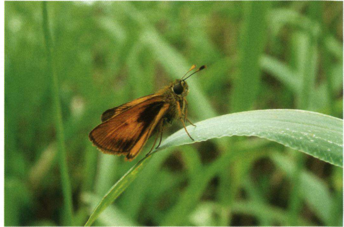
Het dikkopje Euphyes pilatka .

Op zo'n 9000 kilometer afstand van ons koude kikkerlandje ligt midden in de Pacific een klein stukje Nederland: Sint Maarten. Met een constante temperatuur tussen de 26 en 32 °C, zowel overdag als 's nachts. Mijn reis begon in november 2003, Nederlandse temperatuur, ongeveer 3 °C. Bij ons hotel aangekomen zag je al dat dit smullen werd. In een kleine week ben ik er achter gekomen dat Sint Maarten een waar paradijs voor vlinders is, en... het hele jaar door. Voor de ware vlinderliefhebber een eiland om jaloers op te worden: in november op vlinderjacht!