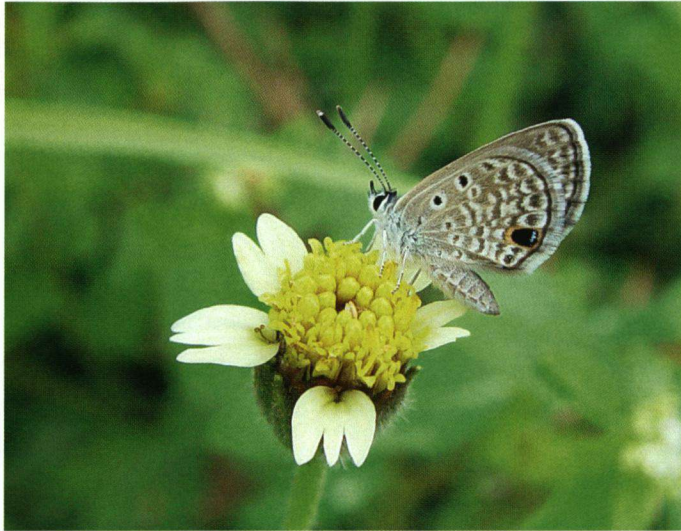
Dit blauwtje is met gespreide vleugels ongeveer 1 cm groot. Een mooie puzzel... Wie herkent dit blauwtje?

vliegen. Van groot tot zeer klein. Het valt niet mee om deze soorten te determineren. Je moet er wel de juiste boeken voor hebben.