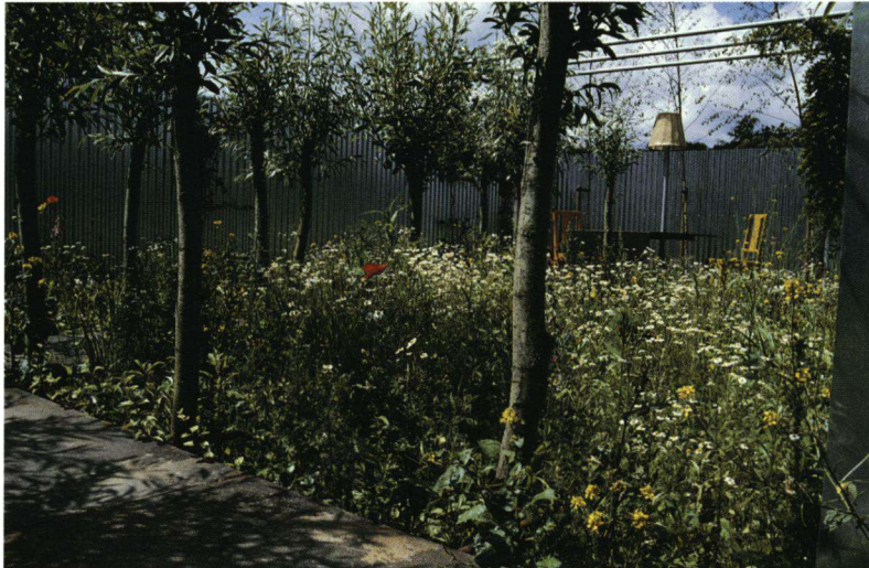
Een stukje Makeblijde.

's Winters zitten we op zoek naar inspiratie met de neus in tuinboeken, maar de zomer brengt ons in beweging en een bezoek aan een tuinkunstpark werkt beslist geestverruimend.