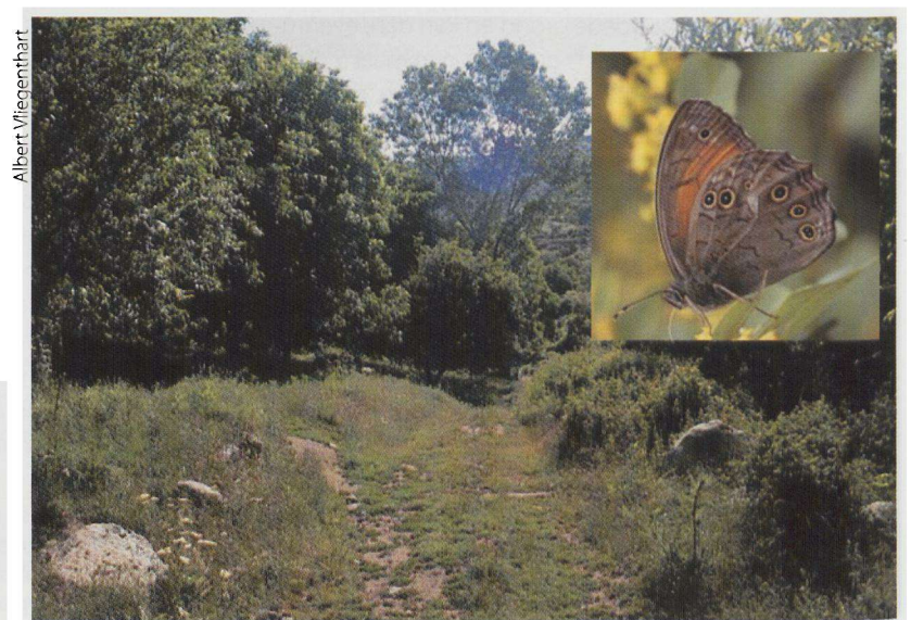
In dit soort beekdalen kan men de grote schaduwzandoog (inzet) aantreffen.

Het Varnousgebergte ligt tussen Florina en het Kleine Prespameer, tegen de Macedonische grens. Het is een vrij groot gebergte waarbij de hoogste top op 2177 meter ligt. Net achter de stad Florina ontpoppen de bergen zich al tot ware vlinderparadijzen en leiden je naar het Varnousgebergte. In tegenstelling