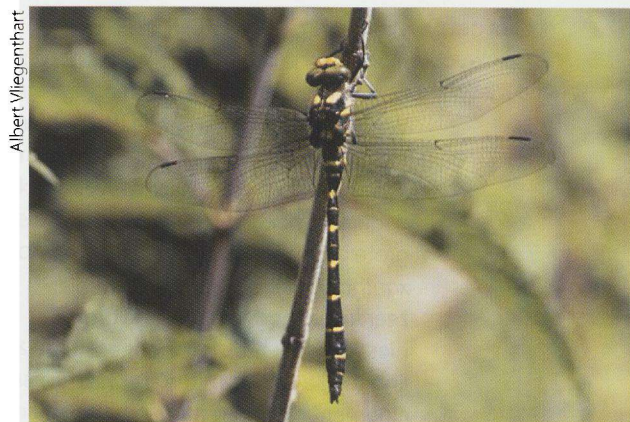
De zuidelijke bronlibel.

In de schaduwrijke plekken kun je lekker lunchen. Maar ook tijdens het eten is het goed opletten. De grote schaduwzandoog ( Kirinia roxelana ) fladdert juist onder de bomen en struiken, zoals zijn naam al doet vermoeden, in de schaduw. Zijn veel zeldzamere broertje, de kleine schaduwzandoog ( K. climene ), is echt