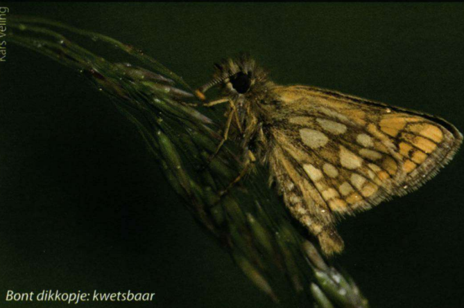
Bont dikkopje: kwetsbaar