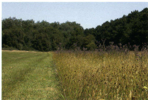
De locatie met veel bloeiende kale jonker.

De oostelijke bosrand werd veelvuldig gebruikt door de vlinders waar ze regelmatig hoog in het kronendak verbleven. Het schraalland is gelegen tegen de helling van het westelijke duingebied het Hagedoornveld en de Ballummerduinen. Een groot deel hiervan wordt sinds 2000 jaarrond begraasd met runderen en paarden. Aan de zuidzijde grenst het schraalland aan de polder Noordkeeg. Recent heeft dit voormalig landbouwgebied de bestemming natuur gekregen en is in de ruilverkaveling ingericht. In 2005 is hier 40 hectare van een voormalige strandvlakte opnieuw afgegraven. De soort vliegt hier dus in een zeer afwisselend terrein met hooiland-, begrazings-, bos- en natuurlijk beheer. Opvallend was dat de vlinders zich in dit enorme gebied van honderden hectares natuur slechts verplaatsten over de 300 meter lange strook met als belangrijkste constatering: "Ze vlogen hier zeven dagen onafgebroken op