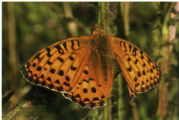
Mannetje zonder rechterondervleugel.

de nectar van de kale jonker". Naarmate de kale jonker in bloeikracht afnam was er ook minder activiteit. De laatste waarneming was drie kilometer verderop, ook weer op kale jonker (Lex Varkevisser).