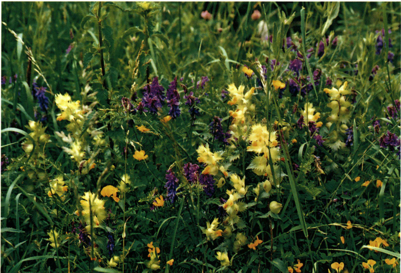
Kleurenpalet aan bloemen.

Een van de landschappelijk mooiste wandelingen kan men maken ten zuidwesten van Setcases in een gebied dat Catllar wordt genoemd. Men wandelt door beboste heuvels en idyllische weilanden omzoomd met struwe-