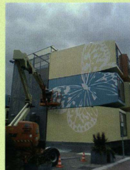
Op studentenwoningen in de Uithof en in Amersfoort zijn vlinderprints aangebracht, om zo de locaties visueel met elkaar te verbinden.

Stichting Vlinderbaan is een particuliere stichting die zich de afgelopen jaren sterk gemaakt heeft voor een vlinderrijke en vlindervriendelijke route tussen Utrecht en Amersfoort. In Amersfoort, Leusden en Zeist