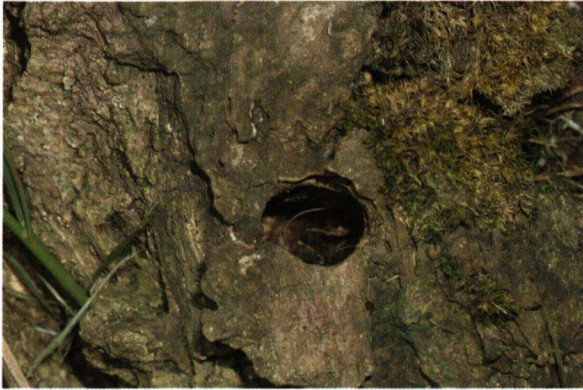
Foto 4: Uitkruipopeningen van de hoornaarvlinder ( Sesia apiformis ) op de stam van een populier.

met een diameter vanaf 20 cm lijken de voorkeur te genieten.