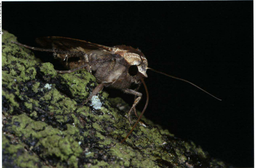
Foto 1. Een alternatieve methode om vlinders te kijken is het gebruik van smeef of stroop. Meestal levert deze methode veel soorten uit de familie van de uilen ( Noctuidae ), zoals hier een huismoeder ( Noctua pronuba ). Niet zelden zijn dat andere soorten dan die waargenomen worden bij een lichtopstelling.