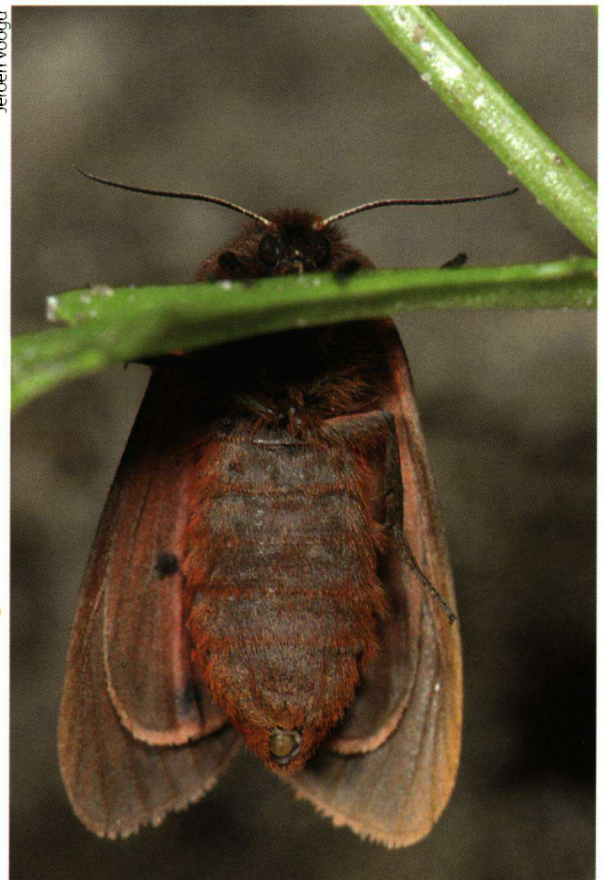
Foto 5. Een vrouwtje van de kleine beer ( Phragmatobia fuliginosa ) met geopende geurklier. Hierdoor verspreidt de vlinder feromonen waardoor mannetjes over grote afstanden in staat zijn om het vrouwtje te lokaliseren.