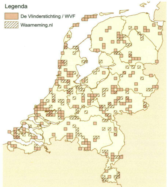
Figuur 1: waarnemingen van de paardenbloemspanner ( Idaea seriata ) zoals gepresenteerd op Vlindernet (periode 1980-2005: roze vierkantjes) en zoals weergegeven via waarneming.nl (periode 2001-2007: gestreepte vierkantjes). Duidelijk is dat de soort op een aantal nieuwe plekken is waargenomen.

nachtvlinders geregistreerd zijn (niet iedereen die nachtvlinders ziet, geeft die gegevens door aan De Vlinderstichting of de WVF), is ook de groep nachtvlinderwaarnemers gering, zeker in vergelijking met bijvoorbeeld het aantal vogelaars. Er zijn twee redenen aan te wijzen die er voor zorgden dat nachtvlinders lange tijd weinig toegankelijk waren voor het grote publiek. Ten eerste werden nachtvlinders tot voor kort beschouwd als moeilijk determineerbaar en werk voor specialisten. In de tweede plaats was er geen goede en complete Nederlandstalige literatuur beschikbaar waarin alle inheemse nachtvlinders beschreven en afgebeeld zijn en die was afgestemd op de Nederlandse situatie.