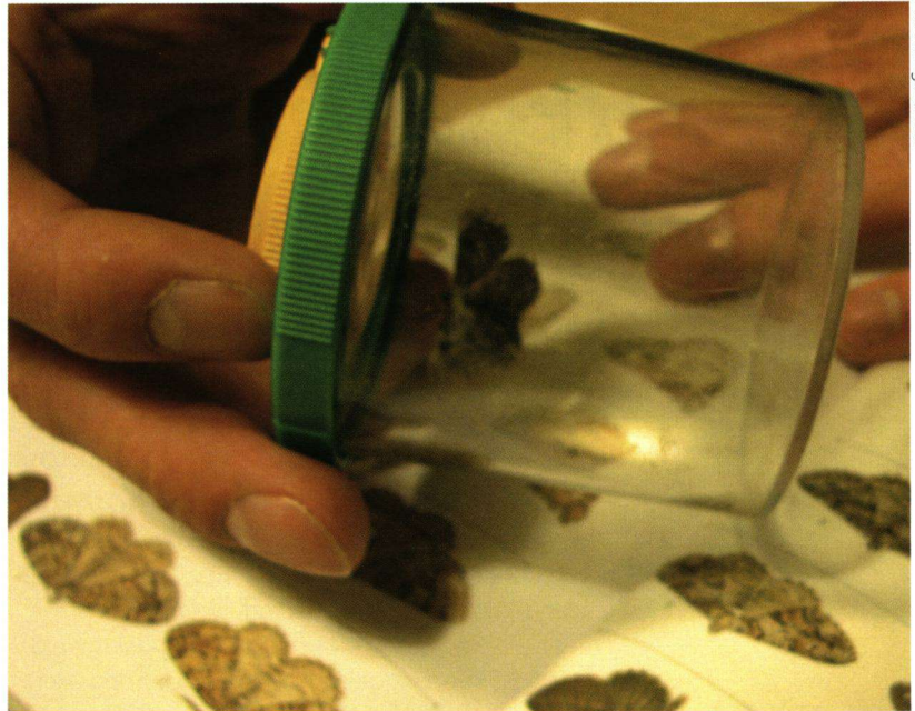
Boven: even een taxusspikkelspanner op naam brengen.

Kortom, met de dagvlinders werd het helemaal niets, maar desondanks had ik een onvergetelijke vliederva-