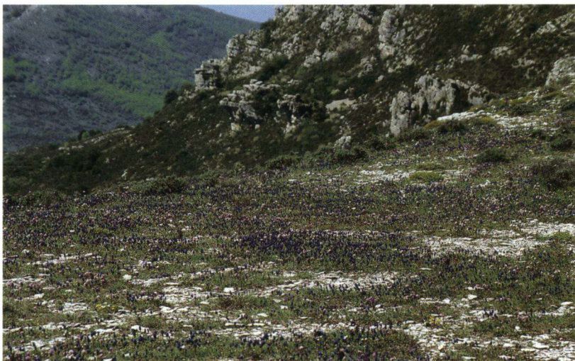
Op het Plateau de Caussols en het Plateau de Calernen bloeit in het voorjaar een zee van blauwe druifjes.

De vlinders zijn gezien in het gebied met Cannes in het zuiden, St. Cézaire-sur-Siagne in het westen, Cipières en Coursegoules in het noorden en St. Jeannet in het oosten. Daarnaast hebben we nog een uitstapje gemaakt in het Massif de l'Estérel.