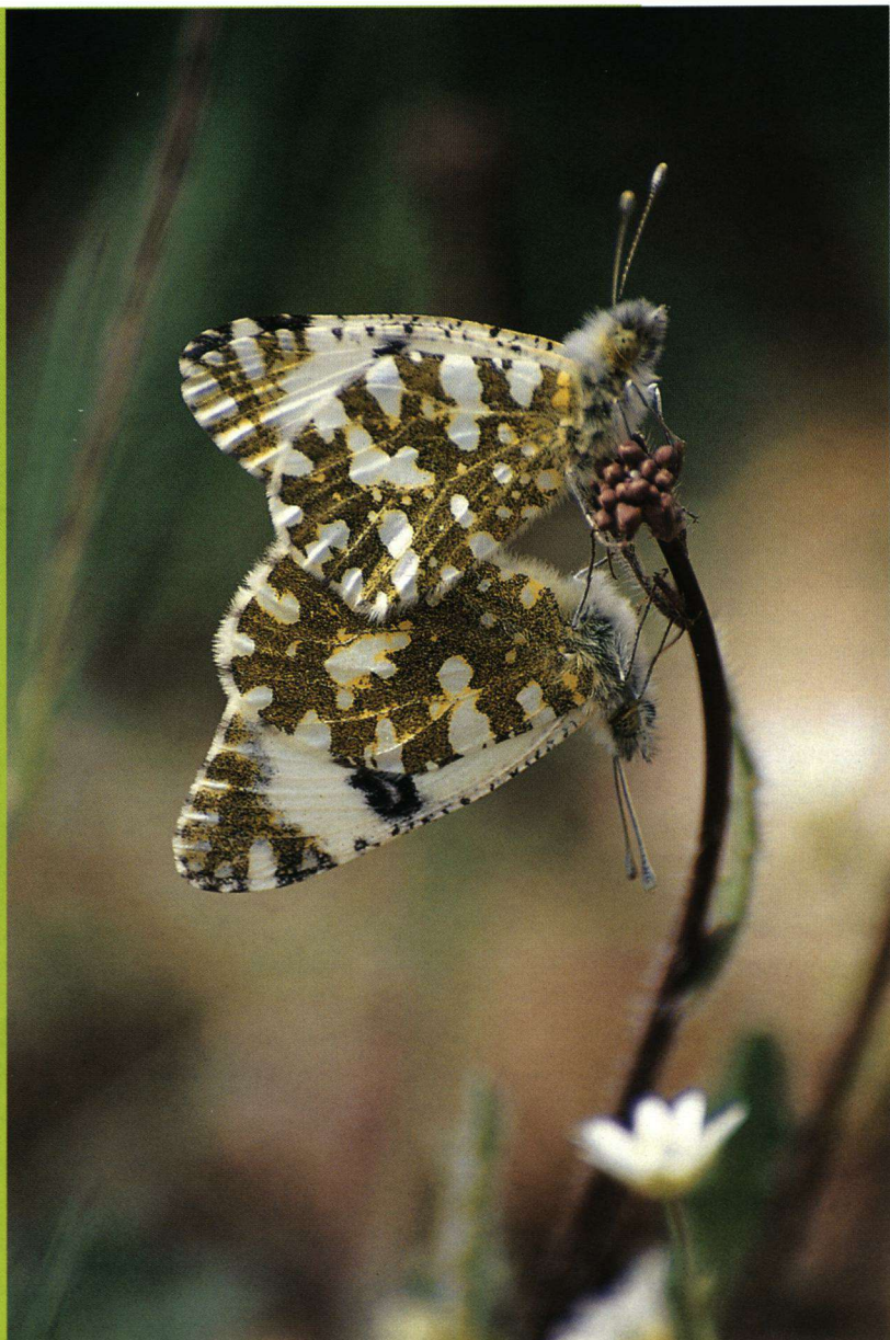
Het westelijk marmerswitje.