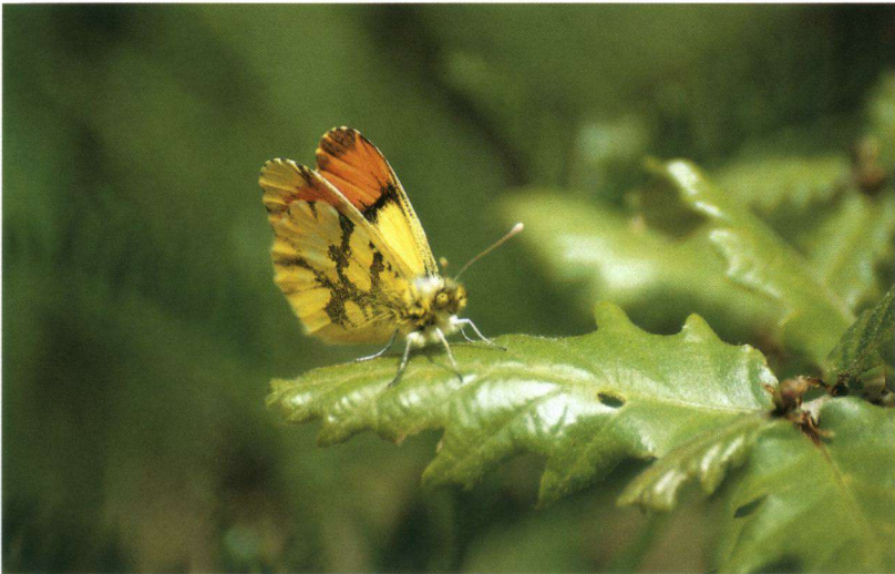
Het geel oranjetipje.