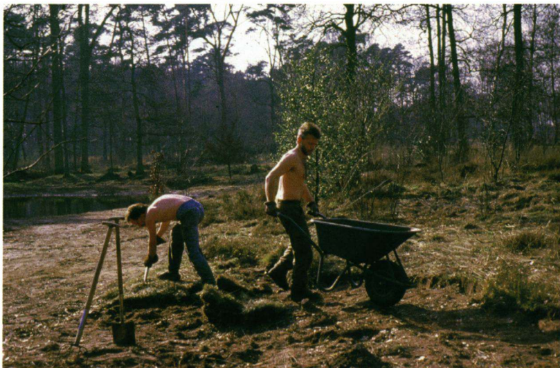
Kleinschalig plaggen loont!