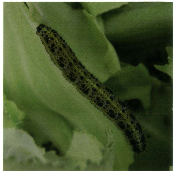
Een van de dertig rupsen van het groot koolwitje. Hij zal nooit een vlinder worden.