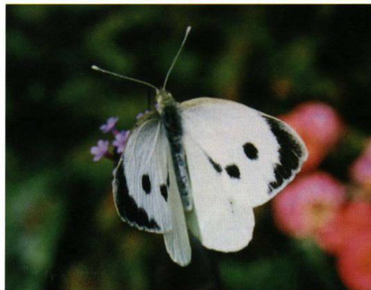
Helaas, dit keer geen nageslacht voor het groot koolwitje.

De dertig rupsen die we in onze volkstuin verzamelden, blijken uiteindelijk allemaal geparasiteerd te zijn. Niet één vlinder is uit de rupsen geboren, wel zagen enkele honderden sluipwespen en twintig sluipvliegen het daglicht.