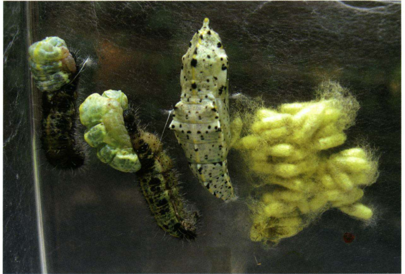
Poppen van diverse pluimage.