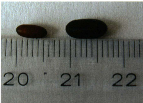
Poppen van de sluipvlieg Epicampocera succincta .

Een week of twee later worstelen de sluipvliegen zich uit hun cocons. Het blijkt te gaan om Epicampocera succincta , een algemene sluipvliegsoort, die het vooral op koolwitjes heeft gemunt. Ze zijn borstelig en hun zwarte lijfjes zijn voorzien van grijzige vlakjes. Oppervlakkig gezien lijken ze op 'gewone' huisvliegen.