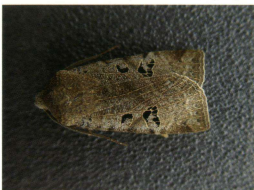
Piet van Nieuwenhoven

Er waren meer waarnemingen van kleine pages de afgelopen maanden. Nee, niet de vlinders zelf, maar de eitjes! Op veel plekken in Nederland is afgelopen winter naar eitjes van kleine pages gezocht. Hoe je dat het beste