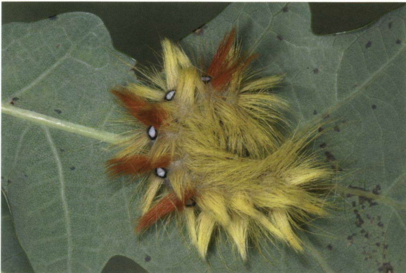
De naam 'bont schaapje' spreekt meer tot de verbeelding dan A