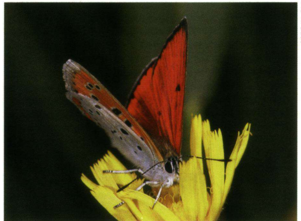
De grote vuurvlinder is een van de soorten waarvoor een beschermingsplan is gemaakt.

Blijf vooral vlinders doorgeven, want dit is de basis onder een efficiënte vlinderbescherming. Samen met het Landelijk Meetnet Vlinders levert dit ons de informatie hoe het met de vlinders gaat, waar extra aandacht nodig is en hoe we die het beste kunnen inzetten. Zo weten we nu dat de veldparelmoervlinder toch nog af en toe in Nederland zit, dat de boswitjes echt zijn gekomen, en dat het tweekleurig hooibeestje echt weg is. Voor de veenvlinders, de veldparelmoervlinder, de grote vuurvlinder en het gentiaanblauwtje zijn beschermingsplannen gemaakt.