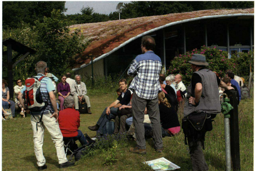
Luisteren naar de instructies op de waarnemersdag bij bezoekerscentrum De Hoep in Castricum.