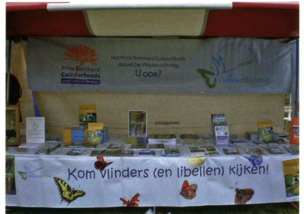
De Vlinderstichtingkraam kon worden ingericht dankzij een financiële bijdrage van het Prins Bernhard Cultuurfonds.