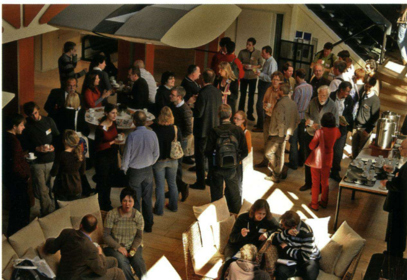
Drukte tijdens het internationale vlindercongres 'Butterflies of Europe II'.