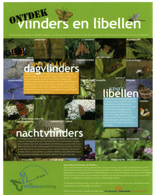
Paneel voor NME- en bezoekerscentra.