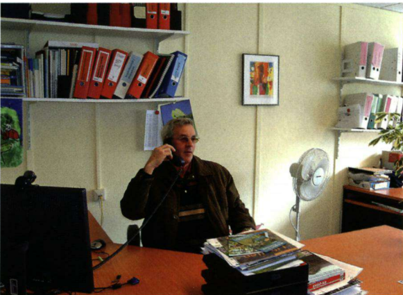
Op de stoel van de directeur tijdens het open huis van het Vlinderstichtingkantoor in de pauze van de Landelijke Dag.