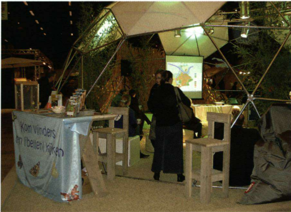
Op de Tuinidee Beurzen in Zwolle, Den Bosch en Goes was De Vlinderstichting met een kraam aanwezig.