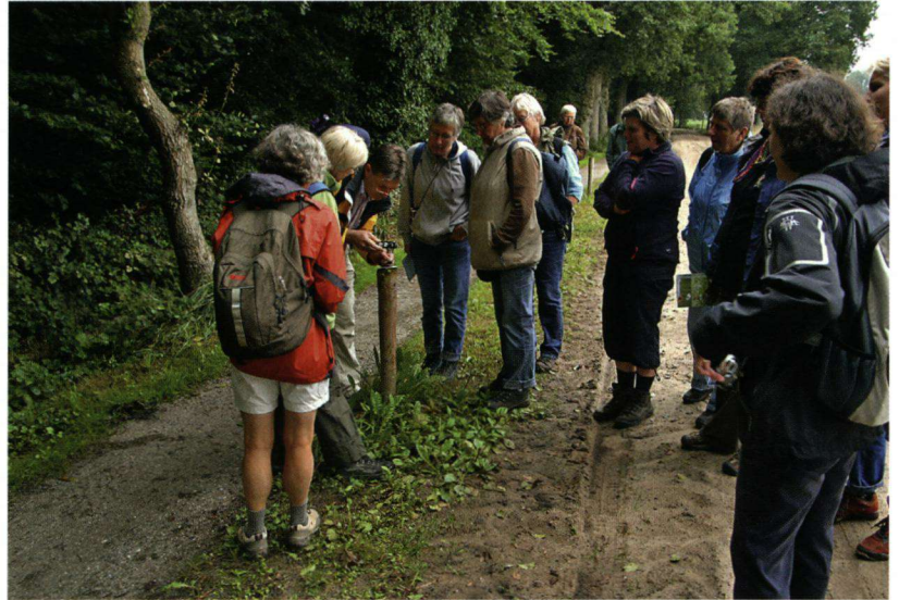
Vlinderen langs het Pieterpad onder leiding van een gids. Alle 92 etappes werden in één weekend gelopen.