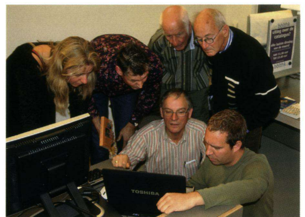
Bedenkelijke gezichten bij de fotopuzzelmiddag.