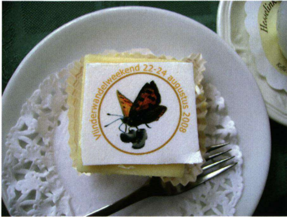
Feestelijk gebak bij de aftrap van het Vlinderwandelweekend in Holten.