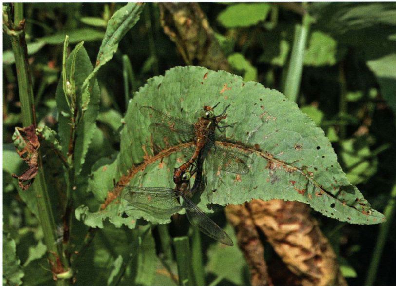
Het paringswiel van de vroege glazenmaker.