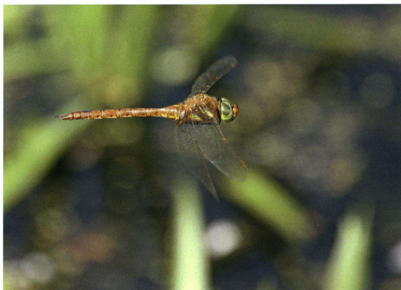
Opvallend bij de vroege glazenmaker zijn het vrij effen bruine lijf en de groene ogen.