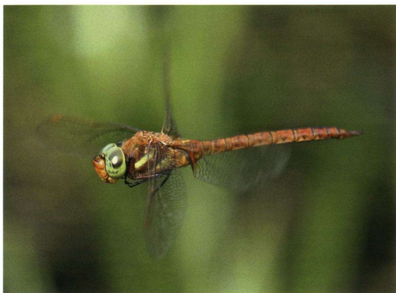
De vier vleugels van libellen kunnen onafhankelijk van elkaar bewegen.

Tekst en foto's: Zaterdagmiddag 7 juni 2008 – Komkleireservaat 'de Regulieren' in de West-Betuwe. Het is mooi weer: libellenweer. Die houden wel van 23 graden, een lekker zonnetje met af en toe een stapelwolkje. Een licht windje vanuit het zuidwesten. Dat wordt aardig gebroken door het aangrenzende populierenbos. Een drie meter brede uitloper van de watergang ligt vol met krabbenscheer. Een favoriete plant van de vroege glazenmaker om de eitjes op af te zetten.