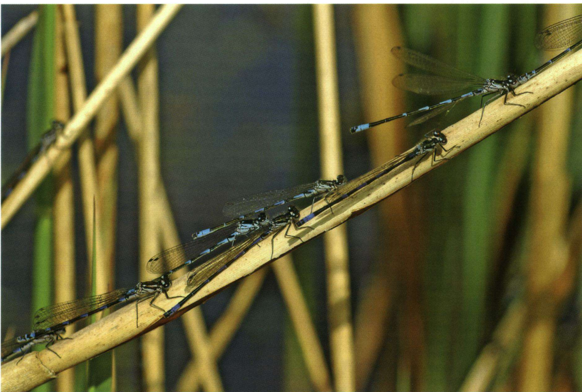
Figuur 6. De variabele waterjuffer kan in laagveengebieden zeer hoge dichtheden bereiken.

Donkere waterjuffer: eigenlijk geen 'blauwe' waterjuffer, maar behoort wel tot dezelfde groep. Lichte delen van het achterlijf (blauw of groen) beperkt tot basis en einde van achterlijf (zoals bij lantaarntje). Basale deel van tweede segment zwart, met twee zijstreepjes. Lange achterlijfsaanhangsels. Zeer zeldzaam: alleen in de Weerribben. ●