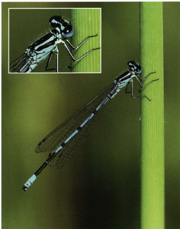
Figuur 4. Azuurwaterjuffer: drie korte en even grote zwarte figuurtjes op de middelste segmenten, voorzien van zijspitsjes.

De azuurwaterjuffer heeft een 'normale' borststuktekening: de blauwe schouderstreep is smaller dan de zwarte schoudernaadstreep eronder. Daaronder bevinden zich op de zijkant van het borststuk twee korte zwarte streepjes onder elkaar (figuur 4). Het zwarte figuurtje op het tweede achterlijfsegment heeft meestal de vorm van een U, die niet met de achterrand van het segment is verbonden (figuur 3) De rest van het achterlijf heeft een uitgebreide blauwe tekening. De drie zwarte figuurtjes