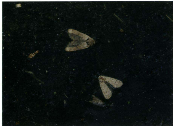
Deze foto geeft een indruk van de dode nachtvinders op het water.

helemaal los rond de paasdagen. Door de betrekkelijk koude winter vliegen de vlinders later dan vorig jaar, maar eigenlijk is het dit jaar weer zoals het eigenlijk hoort. Ook de vuurjuffers en smaragdlibellen waren later dan normaal. Half april werd door Tim de Boer al een groentje gezien bij Hoog Buurlo.