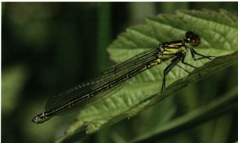
Geen schaduw op de grote roodoogjuffer (vrouwje).

Instellingen digitale spiegelreflexcamera (Canon 30D): Sluittijd 1/250, Diafragma 10,0 en ISO 320. Macrolens: Sigma 150mm.