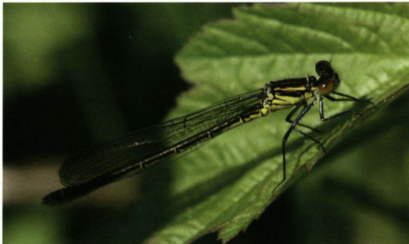
Schaduw op de grote roodoogjuffer (vrouwje).

Instellingen digitale spiegelreflexcamera (Canon 30D): Sluittijd 1/250, Diafragma 10,0 en ISO 320. Macrolens: Sigma 150mm.