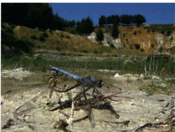
Zuidelijke oeverlibellen in hun omgeving.

Let op de stand van de zon. De beste belichting krijg je als de zon schuin achter je staat. De libel wordt dan goed belicht (geen tegenlicht), terwijl je net niet in je eigen schaduw zit. Voordat je de libel benadert is het verstandig, indien mogelijk, al in de goede lijn tussen libel en zon te staan en dan pas de libel te benaderen. Als je dichtbij de libel staat en je kan door het zonlicht geen goede foto maken, loop dan niet op dezelfde afstand om de libel heen. Grote kans dat de libel door beweging meteen wegvliegt. Loop heel langzaam een aantal stap-