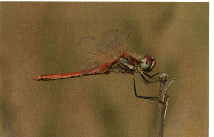
Deze zwervende heidelibel is niet gevangen en niet vastgepakt, waardoor de vleugels in natuurlijke houding staan. Instellingen (Canon 30D): Sluittijd 1/320, Diafragma 10,0 en ISO 400. Macrolens: Sigma 150mm.