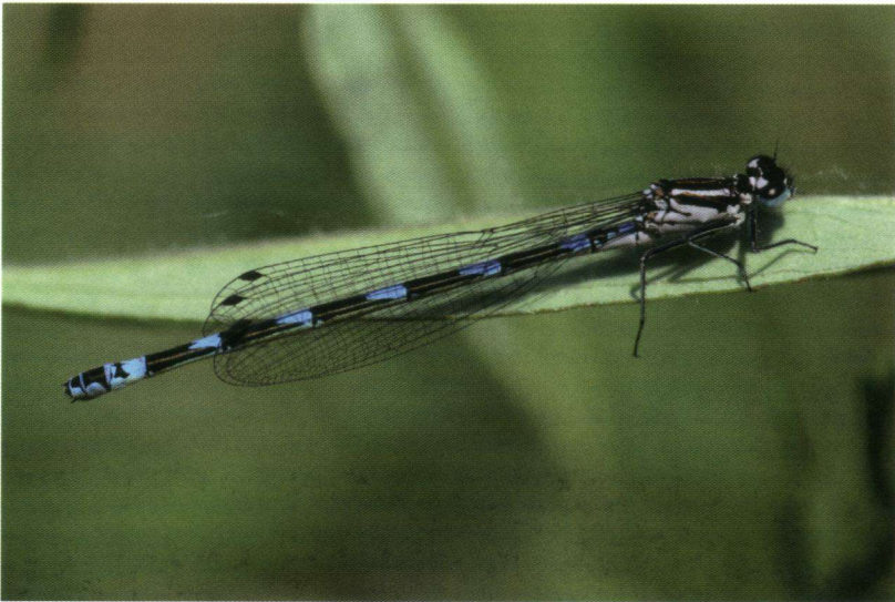
Camera loodrecht op de variabele waterjuffer (vrouwkje).

Instellingen digitale spiegelreflexcamera (Canon 30D): Sluittijd 1/500, Diafragma 4,5 en ISO 100. Macrolens: Sigma 150mm.