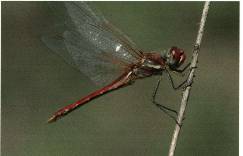
Na het vastpakken staan de vleugels van deze zwervende heidelibel in niet natuurlijke houding. Instellingen (Canon 30D): Sluittijd 1/320, Diafragma 10,0 en ISO 400. Macrolens: Sigma 150mm.