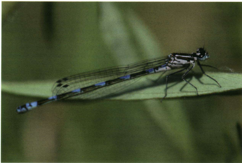
Camera niet loodrecht op de variabele waterjuffer (vrouwkje).

Instellingen digitale spiegelreflexcamera (Canon 30D): Sluittijd 1/500, Diafragma 4,5 en ISO 100. Macrolens: Sigma 150mm.