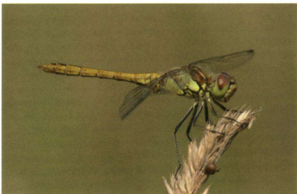
Steenrode heidelibel (jong mannetje).

Het antwoord op deze vraag is afhankelijk van persoonlijke voorkeur en van het doel van de foto. De één houdt van sfeervolle natuurfoto's waarvan de libel slechts een onderdeel uitmaakt, terwijl het de ander puur om de libel gaat met alle kenmerken scherp in beeld. De tips die in dit artikel worden gegeven hebben betrekking op foto's van het laatste type: rustige, duidelijke foto's waarop de soort goed herkenbaar is.