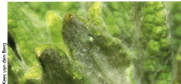
Kees van den Berg

Opvallend was dat de zilveren maan een goed voorjaar kende en ook het groentje was behoorlijk talrijk. En wie heeft ze nog kunnen missen? De enorme aantallen distelvlinders. Vanuit het hele land kregen we, met name eind mei, berichten binnen over tientallen tot honderden vlinders per uur. Niet alleen in Nederland was het raak, in België waren er waarschijnlijk nog meer. Nu begin juli zijn overal rupsen te vinden en over korte tijd zullen we weer kakelverse distelvlinders zien. Wel iets mooier dan die zwaar afgevlogen beesten. Zelf zag ik een vlinder met amper nog halve vleugels gewoon doorvliegen, onvoorstelbaar wat een power er in die beesten zit. Henk Bunjes ontdekte eiafzettende distelvlinders op heelblaadjes in de Dintelse Gorzen, ondanks de directe aanwezigheid van akkerdistels.