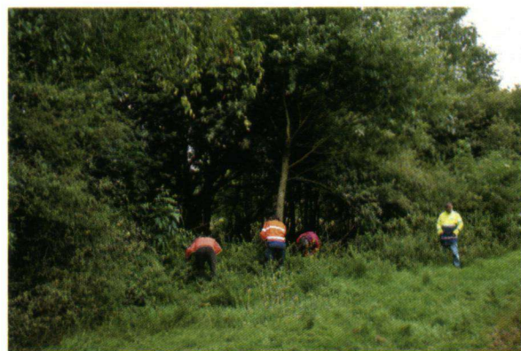
Zoeken naar eitjes in een gefaseerd afgezette haag.