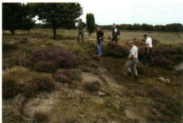
Op pad met beheerders.

In 2006 kwam de Atlas van de Nederlandse dagvlinders uit. In dit standaardwerk wordt veel informatie gegeven over de vlinders in ons land, hoe het ermee gaat en wat er nodig is om het beter te laten gaan. Veel beheerders hebben dit boek in hun werkschuur liggen maar zij hebben niet de tijd om het van voor naar achter door te ploegen. Daarom heeft De Vlinderstichting, met steun van het Ministerie van LNV het project 'Van Atlas naar Actie' uitgevoerd.