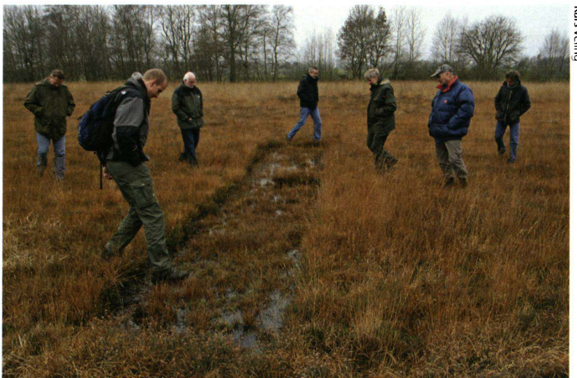
Beheerders bij een kleinschalige plagplek in het Ballòerveld.

Heivlinder, heideblauwtje, kommavlinder en bruine vuurvlinder zijn allemaal sterk achteruitgegaan en alle soorten zijn gebonden aan hei en heideachtige vegetaties. In Drenthe, de Veluwe en Noord-Brabant gingen we dan ook op pad met de beheerders van de heide. Een jaar of twintig geleden was vergrassing het grootste probleem op de heide, maar inmiddels is dat al een heel eind opgelost. Door plaggen en andere maatregelen zijn veel gebieden weer heiderijk geworden. In veel heidegebieden zien we nu vooral de eenvormigheid als een bedreiging voor de vlinders. Heidesoorten houden van een gevarieerde hei, met heideplanten, gras, kale bodem, wat nectarplanten als de hei niet bloeit en hier en daar een boom. Dit soort variatie vind je niet zoveel meer op onze heide. Goede voorbeelden kwamen we wel tegen op militaire oefenterreinen. Daar lag ook de oplossing: er moet meer worden gerommeld op de heide. Sommige beheerders hadden al visioenen over het inhuren van een eskadron militairen om schuttersputjes te graven op hun heide!