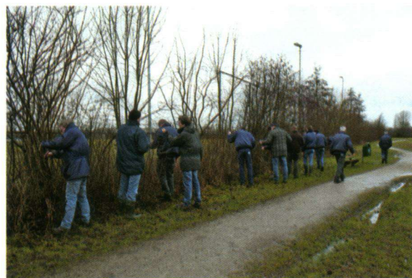
Medewerkers van de groendienst Zwolle zoeken fanatiek naar eitjes.

De sleedoornpage is vooral aanwezig in het stedelijk gebied aan de rand van de Veluwe en van de Utrechtse heuvelrug. In dat stedelijk gebied zijn veel mogelijkheden voor uitbreiding van geschikte plekken, maar ook het