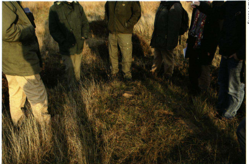
Gerommel door een das op de hei zorgt voor viooltjes.

Yvonne de Jong, die een aantal maanden stage liep bij De Vlinderstichting heeft gekeken naar de plekken waar sleedoorpages zich voortplanten (zie ook 'Vlinders' van augustus). Daarnaast heeft ze een folder gemaakt die informatie geeft over de eisen die sleedoorpages stellen aan hun omgeving en wat een gemeente kan doen voor deze kwetsbare soort. Die folder werd door de beheerders erg op prijs gesteld. Zeker omdat hij digitaal beschikbaar komt en door de beheerders kan worden aangepast aan de plaatselijke situatie. Met wat foto's uit hun gemeente en met ook het eigen logo erop wordt deze dan aan de medewerkers en geïnteresseerde inwoners verstrekt. Hiermee ontstaat draagvlak voor maatregelen. Ze worden trots op zo'n zeldzaamheid in hun eigen woonplaats en zullen er zeker meer aandacht voor hebben.