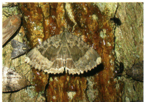
Tijdens de nachtvlindernacht werd het zwart weeskind gezien.