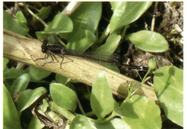
Een extreem donker lantaarntje.