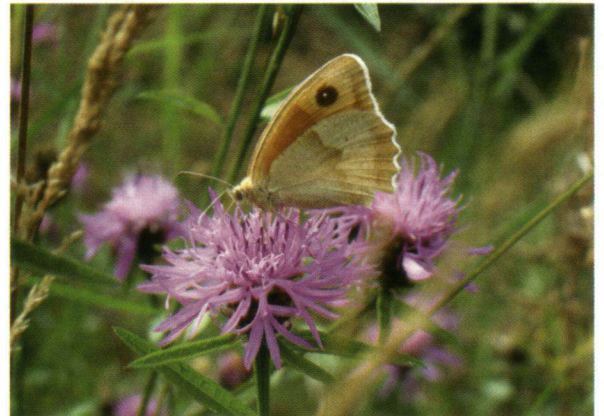
(Niet zo heel) bruin zandoogje.