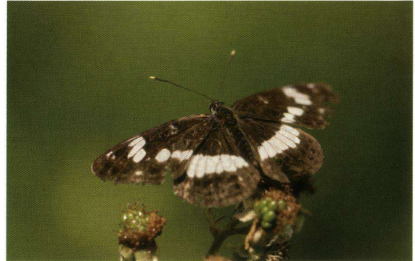
De kleine ijsvogelvinder.

"Enig ongeloof zaaide ik wel, tussen de klasgenoten. De doorsnee scholier is zeer vaardig met computer en games, blinkt uit op het hockey- en tennisveld, of kent alle typen auto's uit het blote hoofd. En tussen alle onderwerpen, van aerodynamica tot racisme, van tuinarchitectuur tot mode, stond ook 'De kleine ijsvogelvinder in het Leusveld'. Van Anne Krediet, die noch toetsenbord, noch tenn racket, maar het vlindernetje hanteert. En die niet een Mercedes van een BMW, maar wel een trapeziumuil van een zwarte c-uil kan onderscheiden".