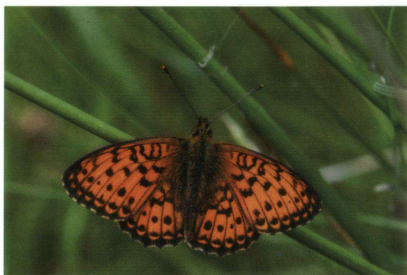
Lastig bestje: de purperstreepparelmoervlinder.