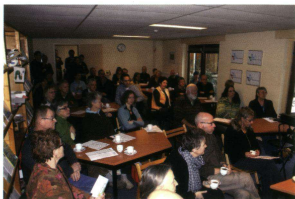
De helft van de ruim vijftig bezoekers.

libellen op naam te brengen. Na de lezingen kon iedereen nog even napraten en nagenieten met een hapje en een drankje. De deelnemers hebben de belangrijkste samenvatting per e-mail thuis ontvangen en iedereen is om een evaluatie gevraagd. Hieruit bleek dat men over het algemeen zeer tevreden was, maar dat er voor een volgende puzzeldag zeker nog verbeterpunten zijn. We kijken zelf ook terug op een zeer nuttige, leuke en succesvolle puzzeldag en we zullen deze zeker vaker herhalen. Mensen van de wachtlijst krijgen dan zeker voorrang!